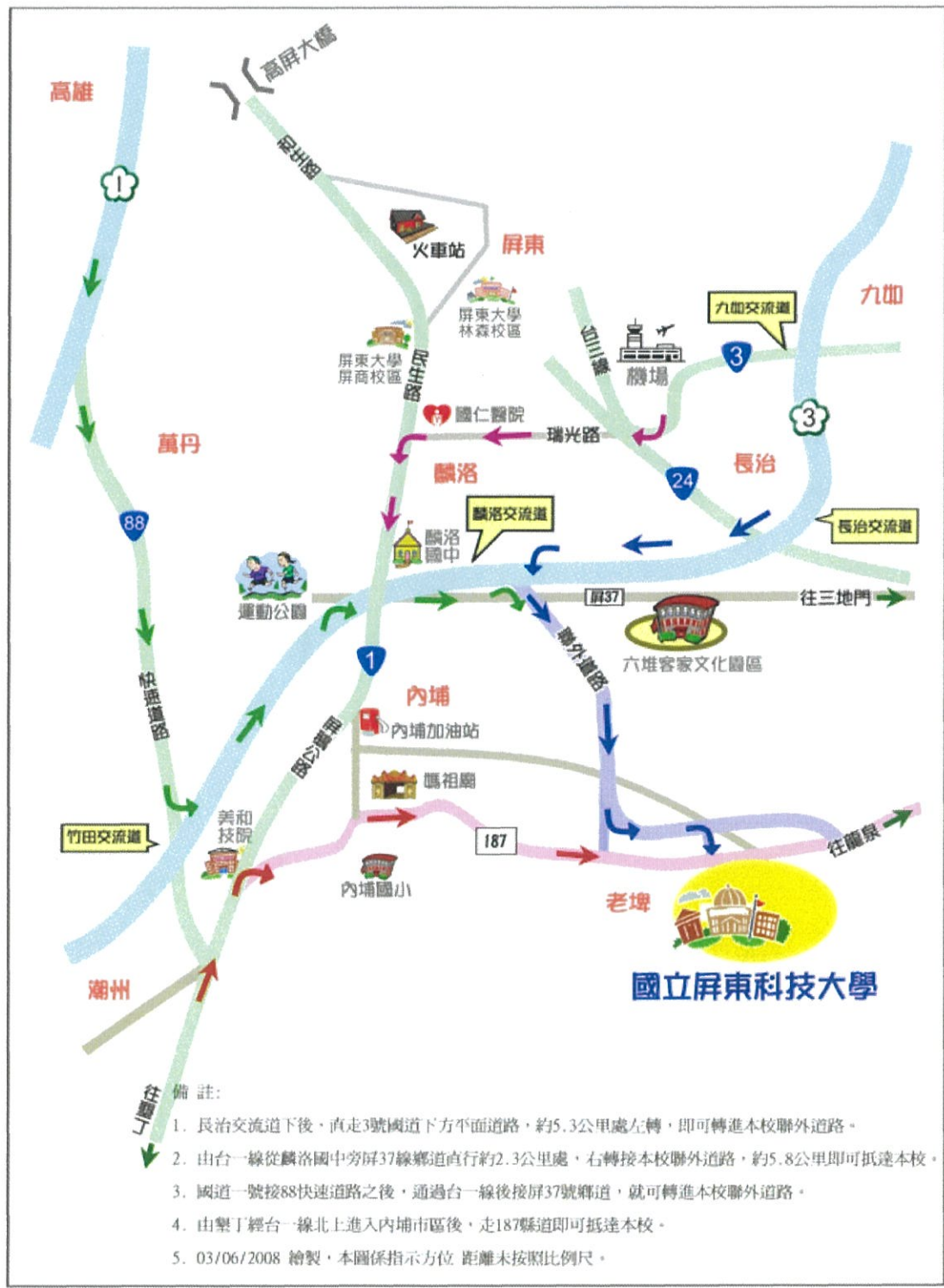
國立屏東科技大學位置示意圖